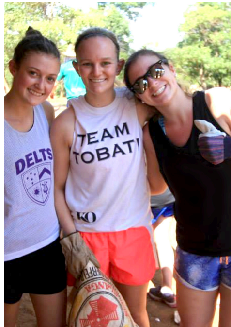
左图：Tobati 团队的学生在巴拉圭支援住房建设

踏上改变人生之旅。20 余年来，KO 70% 以上的高中生在巴拉圭参加了这项独特的服务学习机会。在 10 天的时间里，学生与社区成员一起生活和工作，执行重要的服务计划，例如修建学校和医院。